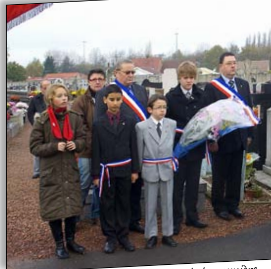
Le 11 novembre, c'est l'armistice de la première guerre mondiale de 1914-1918.