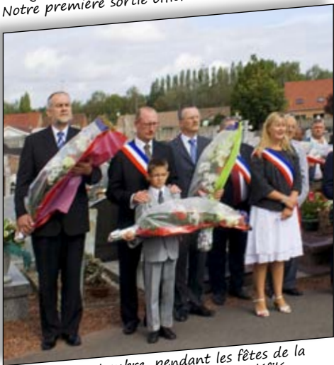
Début septembre, pendant les fêtes de la Libération, il y a toujours un défilé et un dépôt de gerbes