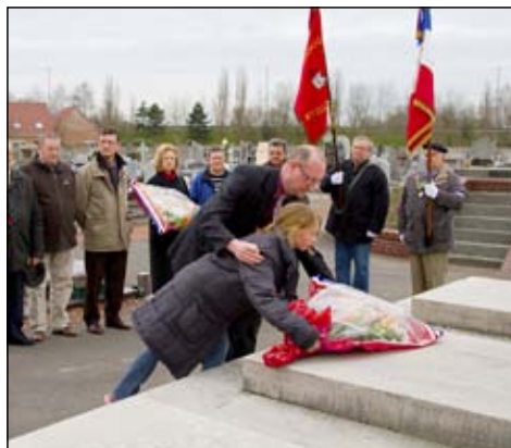
Le 19 mars, c'est la commémoration de la fin de la guerre d'Algérie qui s'est terminée en 1962.