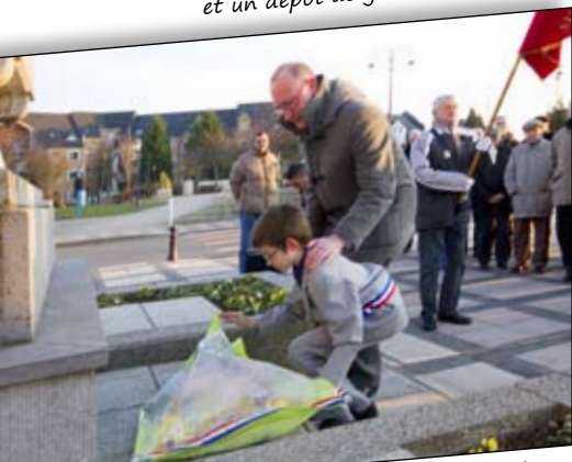
Le 10 mars, c'est la commémoration de la catastrophe des mines de 1906