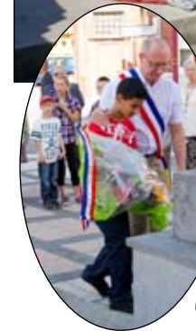
Le 14 juillet, évidemment c'est la fête nationale. C'est un défilé où il fait beau, c'est agréable car parfois on défile sous la pluie et avec du vent. Après chaque défilé, il y a une réception avec des biscuits apéritifs et des boissons. Le 14 juillet, la réception se fait dehors.