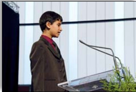
Fin 2009, le maire nous a demandé de parler aux vœux à la population en janvier 2010. On a désigné 3 personnes qui ont parlé au nom de tout le groupe. Ils avaient vraiment le trac car ce n'est pas facile de parler devant 600 personnes mais ça s'est très bien passé !